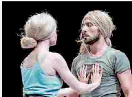
● La performance del duo C&C