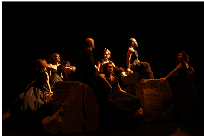
EL de Simone Mannino

La follia visionaria di Eliogabalo consiste nel fondere tutti i culti in uno solo, anticipando l'affermazione del cristianesimo senza abbandonare Dioniso. Questo ne fa una figura di profondo fascino e modernità, vissuta intensamente come una rockstar e capace di incarnare il mito dell'immaginazione al potere, pur rimanendo legata agli archetipi antichi.