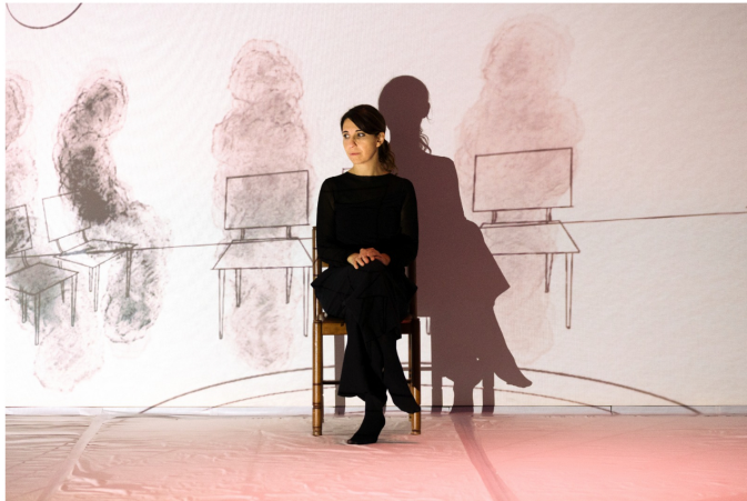
Festival Inventaria, PSYCHODRAMA

Il festival Inventaria – la festa del Teatro off – presenta nella sua 14ma edizione, in quattro teatri romani: 17 opere delle quali 14 prime, tra nazionali e romane – provenienti da tutta Italia – che mettono in scena la drammaturgia contemporanea caratterizzata dalla pluralità dei linguaggi, icone di una programmazione tanto fitta quanto variegata.