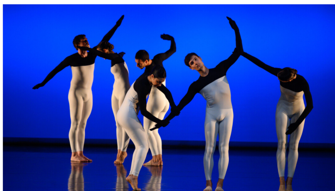
Beach Birds di Merce Cunningham