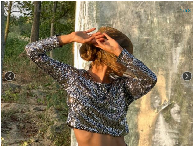
"Paradiso [Giardino]" di Gruppo Nanou