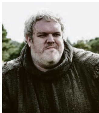
Il fascino dei manga che diventano realtà; sopra, l'attore nordirlandese Kristian Nairn del "Trono di spade"