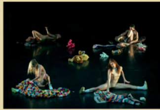
Compagnia Enzo Cosimi in Coefore Rock&Roll

info@mosaicodanza.it | (39) 011.661.24.01 | mosaicodanza.it