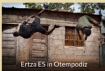
Ertza ES in Otempodiz