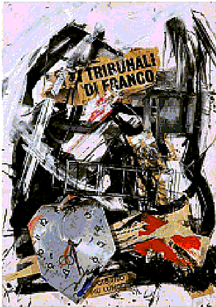
Emilio Vedova, Per la Spagna '61-62 - 1/6 (1961-62) .