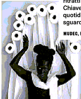
Zanele Muholi Aphelie X, Durban 2020 .