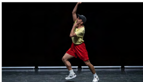
Casa del Teatro, It won't be like this forever , ph: Andrea Macchia

Il coreografo anche con questa performance rimane fedele al suo stile poliedrico , tipico delle sue ultime produzioni. Il basso continuo di questo progetto coreografico coincide con il suono prodotto dai salti, dal battere delle mani, da un ritmo creato costantemente dal corpo in movimento; mentre l'atmosfera si fa più poetica e sensibile quando la musica fa la sua entrata. Pose di resistenza, combattimento e vittoria, mascolinità stilizzata, cultura giovanile, balletto classico, ballo liscio e sport si trovano in rapida successione per creare un'assurda, sovrapposta e ironica sequenza di elementi eterogenei.