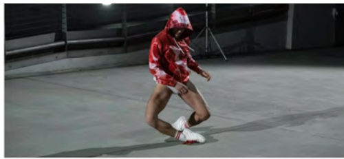
Casa del Teatro, Metamorphosis, ph: Andrea Macchia

In un'era dell'apparenza ci possiamo riscoprire fragili animali, proprietari di un involucro esterno da riempire, plasmare o esibire e questa serata di Interplay ci offre due possibili sguardi, entrambi in grado di condurci verso una riflessione profonda: accanto all'ironia vi è la possibilità di caricare il corpo di significati alquanto profondi.