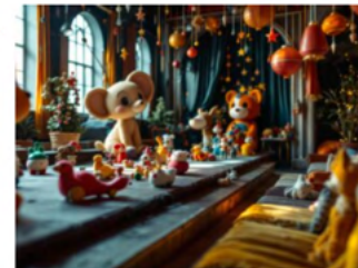
Giocagiocattolo: un viaggio magico nel mondo dei giocattoli a Milano