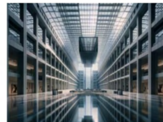
Soani e parole di speranza: