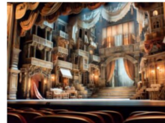
Nuove produzioni teatrali e danza contemporanea in arrivo a gennaio