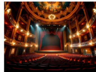
Il ritorno del Formoso Therapy Show: un viaggio nel benessere