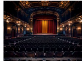
Teatro Officina: un patrimonio culturale da salvaguardare